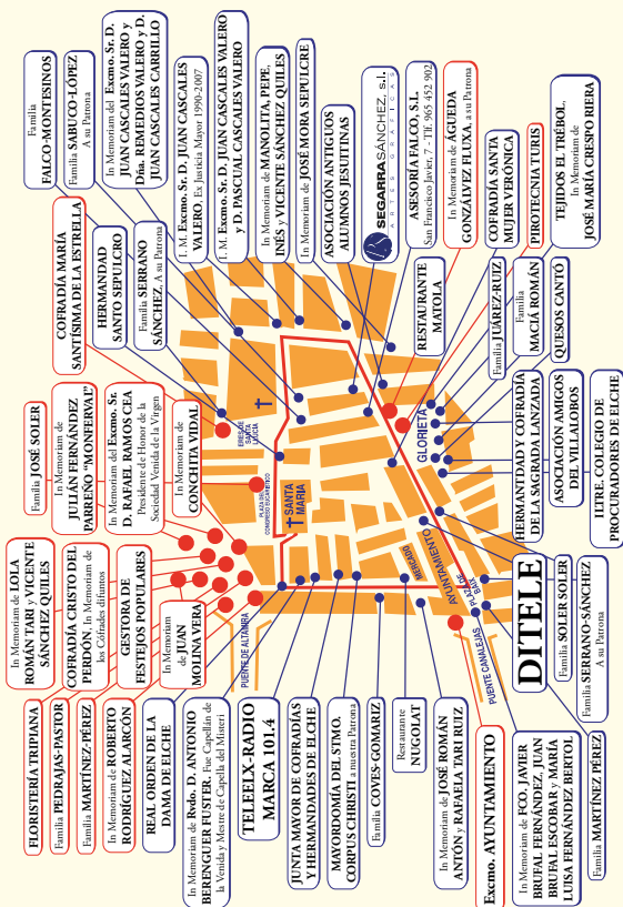
RELACION DE TRACAS Y COHETAS PARA CELEBRAR EL PASO DE NUESTRA PATRONA, LA VIRGEN DE LA ASUNCIÓN, EN LA PROCESIÓN DEL DÍA 29 DE DICIEMBRE.

En la mañana del día 29, al comenzar la Procesión, se disparará una extraordinaria traca desde la Basílica de Santa María, siguiendo todo el trayecto de la Procesión. Esta traca será patrocinada por todos los anunciantes aquí indicados y en su nombre será el Cremador de Honor Centro Aragonés de Elche .